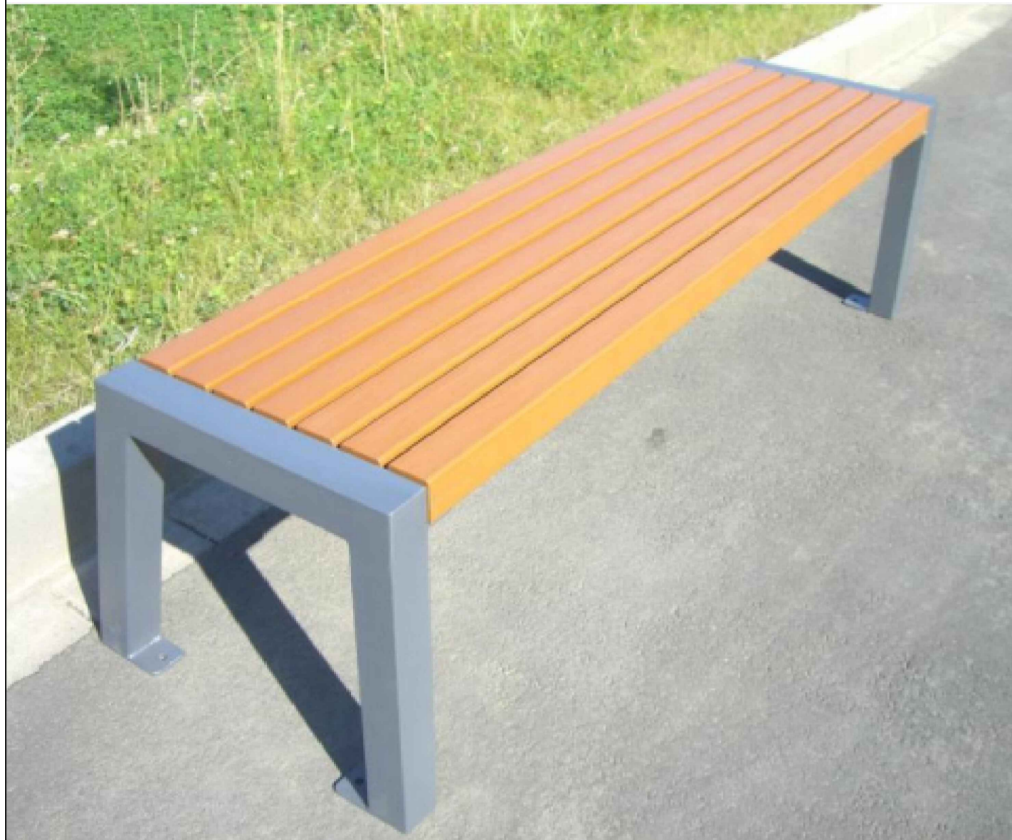
Referenz foto : Bank ohne Lehne