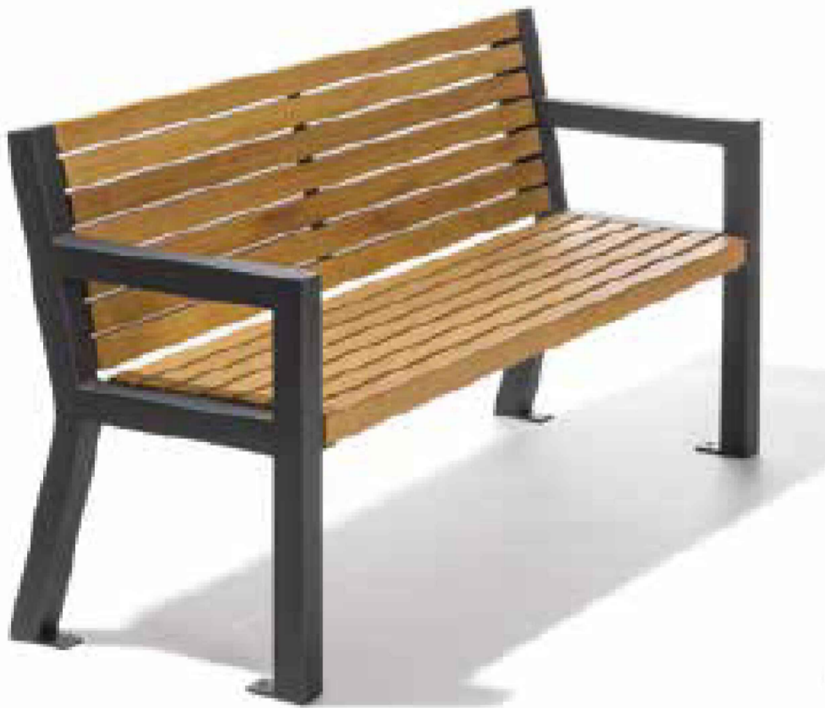
Referenz foto : Bank mit Lehne